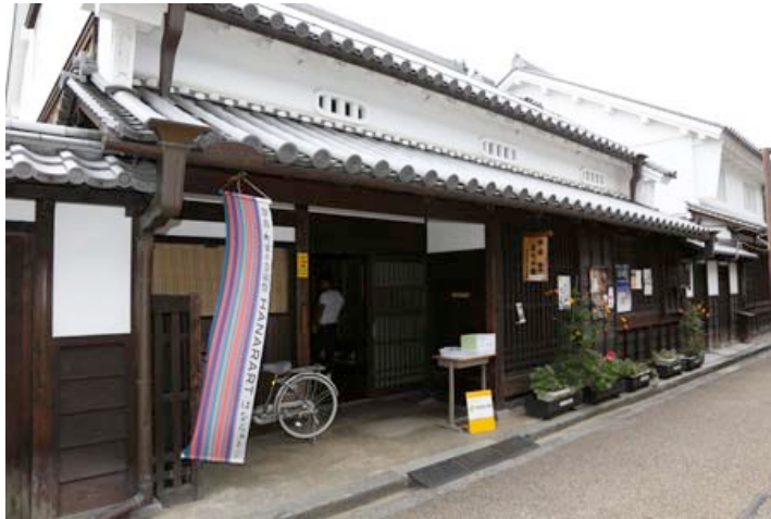
※奈良・町家の芸術祭 はならあと 2013 開催中の様子