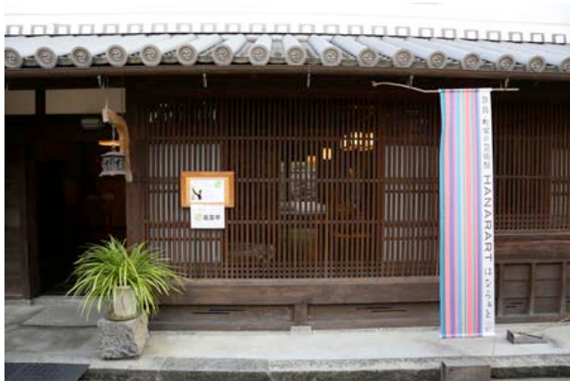
※奈良・町家の芸術祭 はならあと 2013 開催中の様子