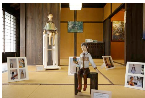
※奈良・町家の芸術祭 はならあと 2013 開催中の様子