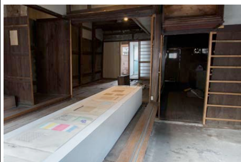
※奈良・町家の芸術祭 はならあと 2015 開催中の様子