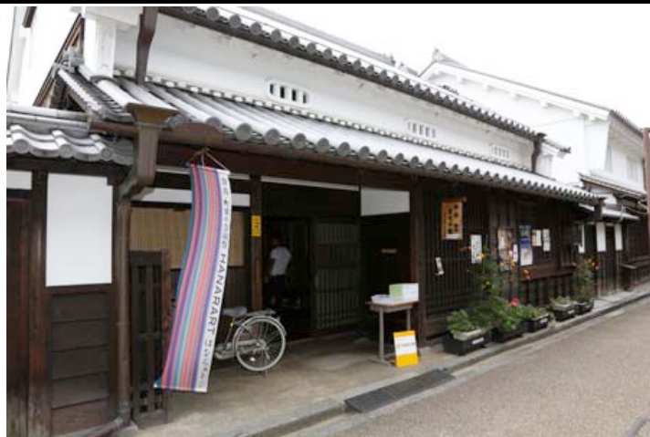
※奈良・町家の芸術祭 はならあと 2013 開催中の様子