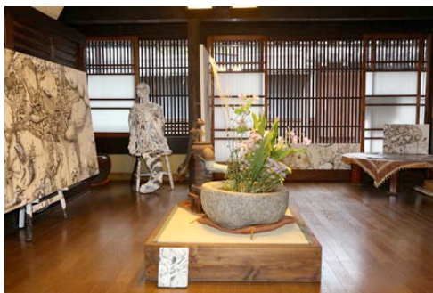
※奈良・町家の芸術祭 はならあと 2013 開催中の様子