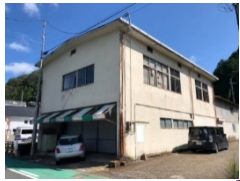
旧JA柳生マーケット(常設展示)