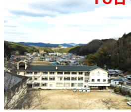
旧柳生中学校 (メイン会場/駐車場) 16日・17日