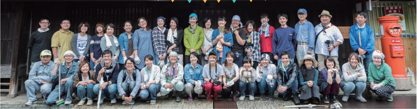
2015.7.7 宇陀松山エリア はならあと部 お掃除活動にて