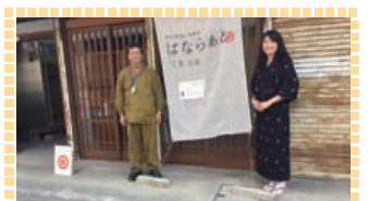
イベントを盛り上げよう! 会場の受付・見守り

人と接することが好きな方・コツコツ作業することが好きな方・趣味を活かしたい方・奈良のまちづくりに参加したい方、大歓迎!! 『はならあと部』は、リーダーが存在する“組織”ではありません。多岐に渡る活動の中から、自分がやりたいことや活かしたいことを発見し、積極的に参加して下さる方におすすめです。『はならあと』はまだ未熟なイベントです。共に、成長していきましょう!