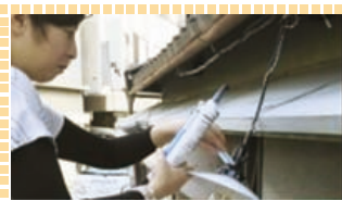
アートの現場を体験しよう! 作品制作のお手伝い